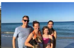
Host Family Life