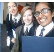
Australian High School