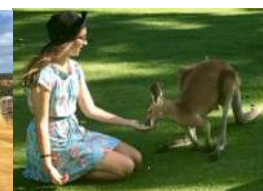
Caversham Wildlife Park