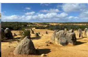
Deserto dei Pinnacles