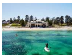
Spiaggia cittadina di Cottesloe