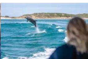
Delfini a Mandurah